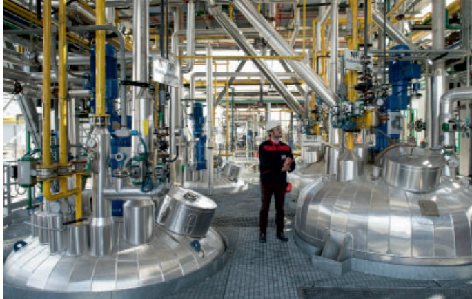
新しい製造拠点 ・カラマ(米国ワシントン州) ・ロッテルダム(オランダ) ・ウィッドネス(英国)